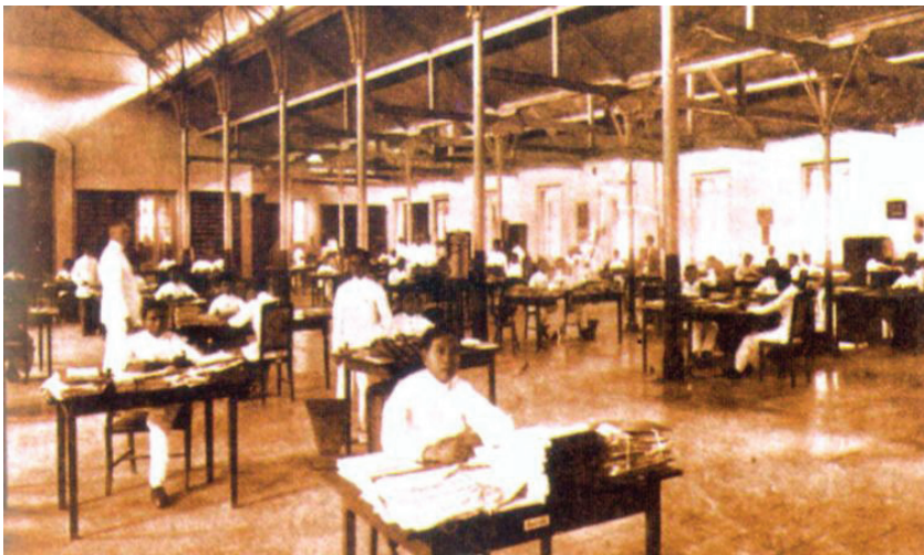
Gambar 1 Kegiatan redaksi di Balai Pustaka tempo dulu (Balai Poestaka).

Deretan tokoh pribumi yang menjadi redaktur atau pemimpin redaksi Balai Pustaka sejak awal berdiri hingga masa perang kemerdekaan dapat disebut sebagai peletak fondasi berkembangnya ilmu penyuntingan naskah di Indonesia dalam konteks penerbitan modern. Mereka mendapat gemblengan langsung dari orang-orang Belanda yang telah lebih dulu berpengalaman dalam dunia penerbitan.